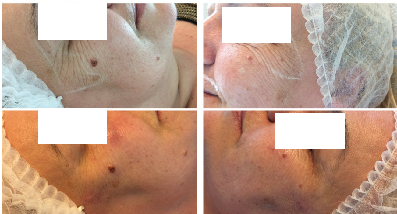
Elravie Balance 1,5ml kanylou do okolia očí