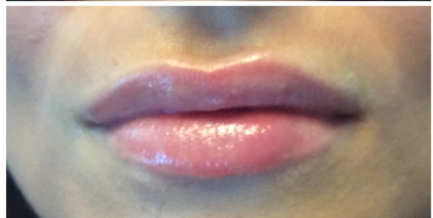
Elravie Light 1ml do pery