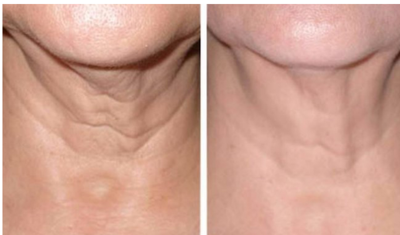
Elravie Balance 1,5ml pomocou Vital Injectora do krku