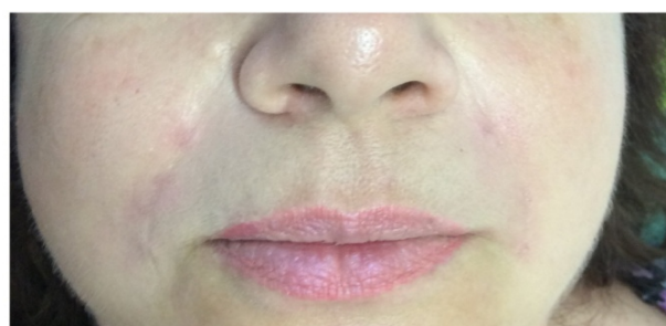
Elravie Deep Line 1ml do nosovoústnej ryhy