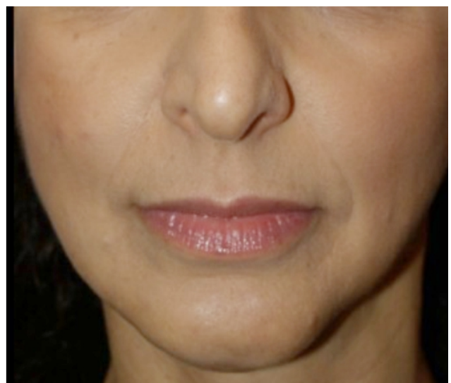
Elravie Ultra Volume 2ml do líca