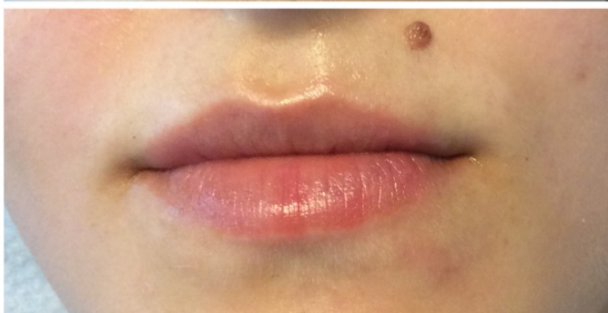
Elravie Light 0.5ml do pery